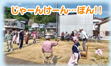
じゃーんけーん…ぼん!!