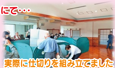
実際に仕切りを組み立てました