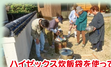
ハイゼックス炊飯袋を使って炊飯。その後試食を行いました。