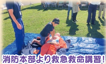
消防本部より救急救命講習!

今年で8回目になるニコニコまつりは、地区、婦人会、消防団などが中心となり、世代間で楽しめる内容で賑やかに開催されています。