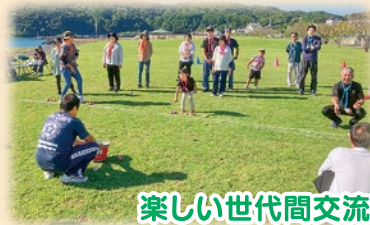
楽しい世代間交流、でも競技は真剣勝負!