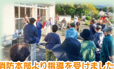
消防本部より指導を受けました!

当日は、訓練用の防災無線を合図に一次避難。その後、区長場に集合して防災炊き出し訓練を行いました。