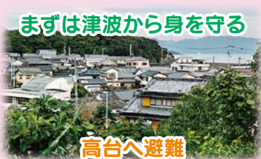
まずは津波から身を守る

「津波防災の日」にあわせて、住民としおさい合同で行いました。防災の講話や、実際に簡易ベッドやパーテーションを住民が設置しました。