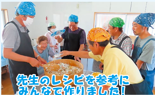
先生のレシピを参考にみんなで作りました!

次回も!!という声も聞かれたので、この機会を通じて久百々の伝統がつむがれていくよう、引き続き取り組んでいけたらいいですね!!