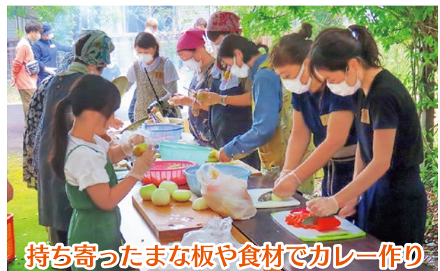
持ち寄ったまな板や食材でカレー作り