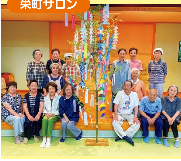
短冊に願いを込めて!