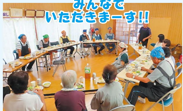
みんなでいただきまーす!!