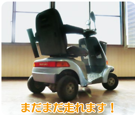
まだまだ走れます!