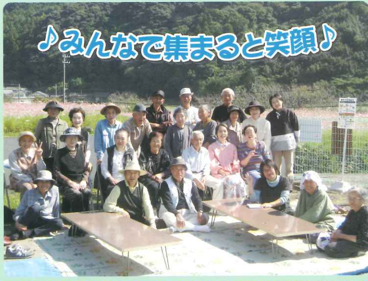
♪みんなで集まると笑顔♪