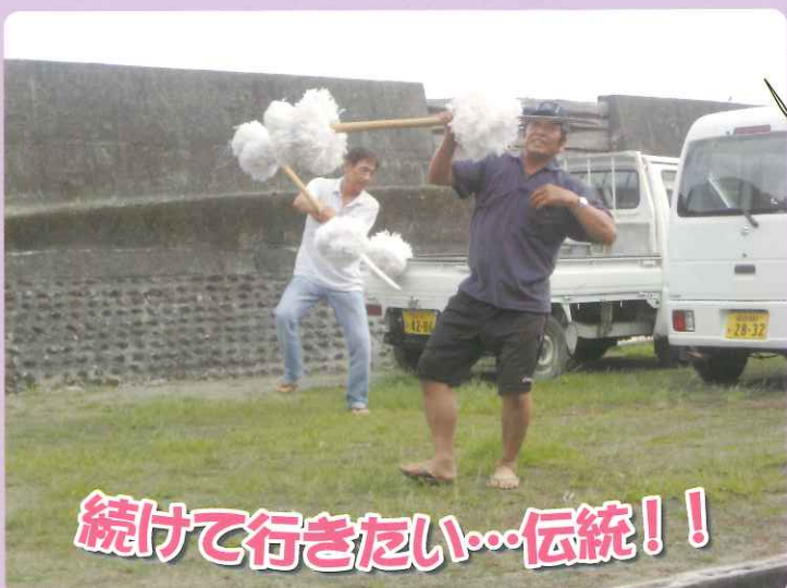
続けて行きたい…伝統！！